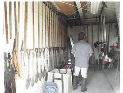
安全のために整理された倉庫内

審査に当たっては、費用が発生しますが、国や県では認証取得を希望する生産者に対して、審査費用、取得に係る費用を支援する事業を実施しています。