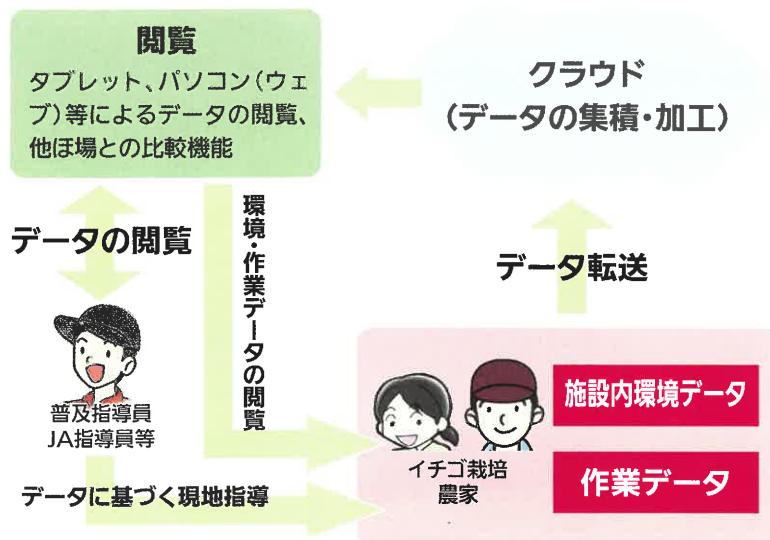
図 ICT活用による「見える化」のイメージ

イチゴで、「香川型高設栽培(らくちん)システム」を改良して、平成29年度から、環境(温度、CO 2 など)・作業データを、スマートフォンやタブレット端末で閲覧できる新システムの実証試験を行った結果、過去2年間の実証では、導入後の収量が1.2倍へ増加するなど一定の成果がみられました。今後、指導機関や生産者グループ間で、情報の共有により、産地全体の技術として収量・品質の向上が期待されます。