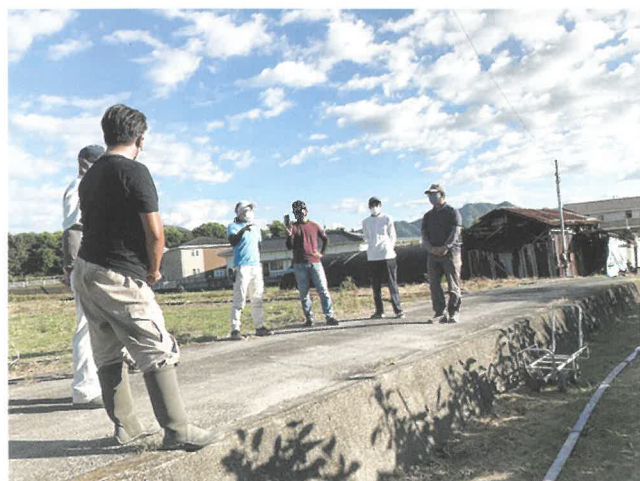
クラブ員の圃場にてオンラインを併用した研修

「西讃農業者クラブ」への加入を希望される方は、事務局(普及センター担い手部門)まで気軽にご連絡ください。