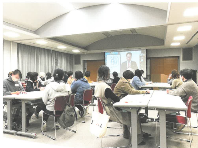
アグリレディススキルアップ研修

また、講演後には、講演で学んだ会話の「3つのコツ」を実践しながら、将来の目標や日頃の悩みについての意見交換を行いました。参加者は、「これからは、自分自身に力を与える質問を心掛けたい。」、「会話のコツを家庭で実践したい。」、「同じ立場の女性農業者と交流でき、元気ももらった。」など、意見が尽きず時間を超過するほど盛況となりました。