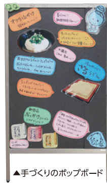
▲手づくりのポップボード

そうした雰囲気づくりのために、特別なことはしていませんが、問題があれば、月1回の全体会議、店長会議において全員で話し合い、解決を目指します。パートさんは働く日時がまちまちですから、朝礼ではなく“昼礼”を行うようにしました。また、月に2～3回のミーティングも行っています。さらに、“連絡ノート”を作成し、会議で決定した連絡事項などを書き込んでもらい、読んだ人は必ずチェックを入れるようにしました。