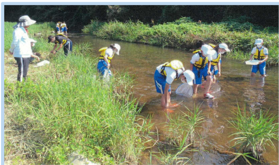
綾川町立綾上中学校 「綾川」